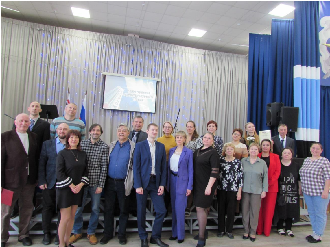
Пресс-центр ФГБУ «Камчатское УГМС»