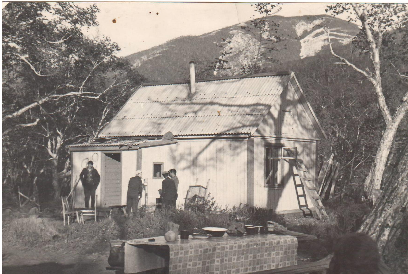
Ремонт дома наблюдателя на посту р.Половинка – 13.7 км от устья