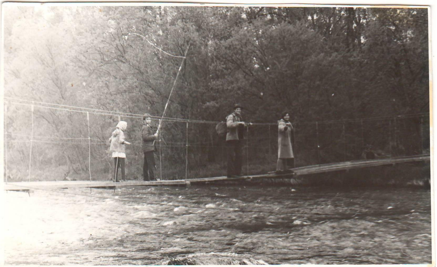
Гидрометрический мост через реку Средняя Авача