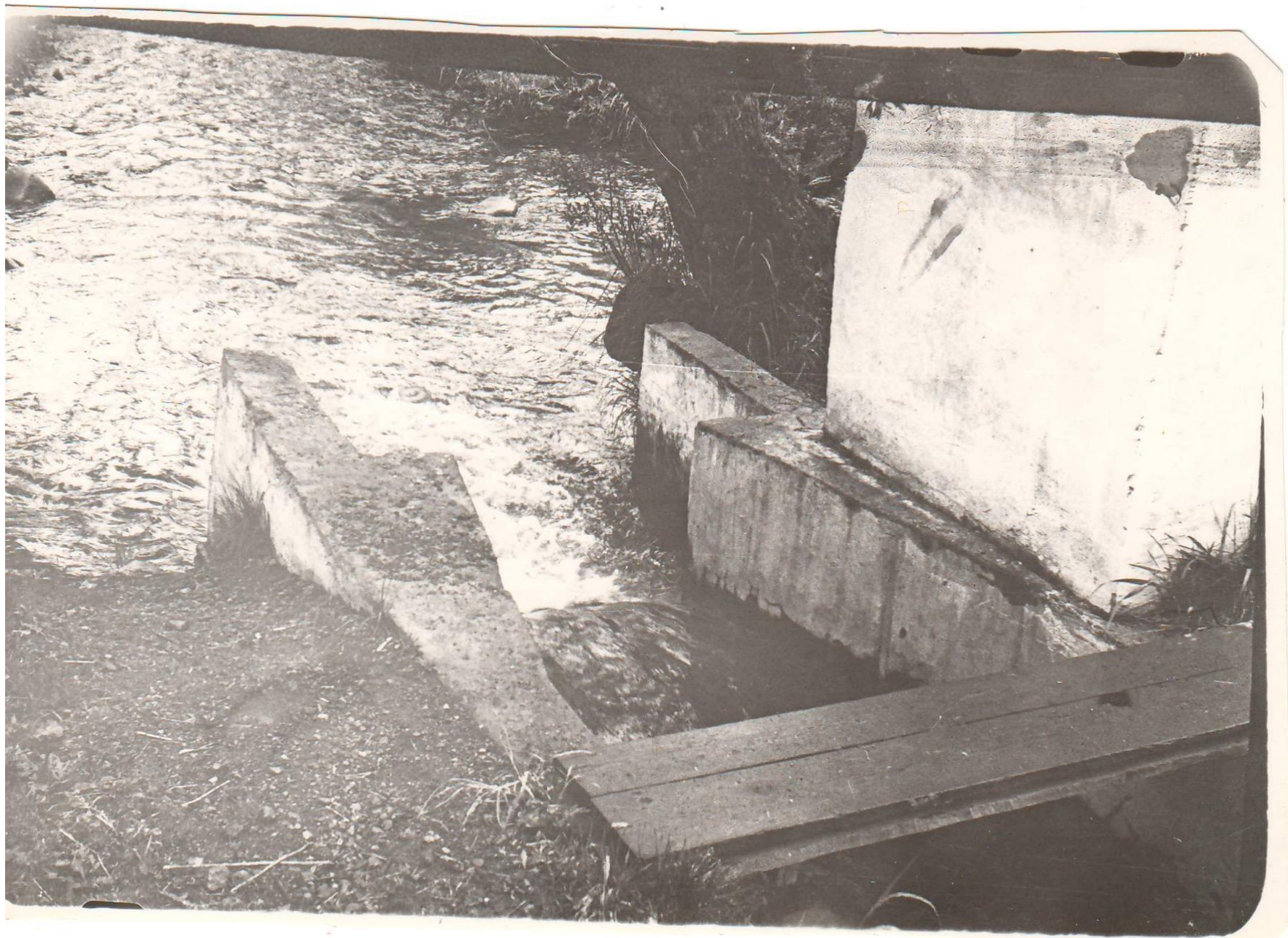
Гидрометрический лоток. Ручей Коркина. с. Паратунка