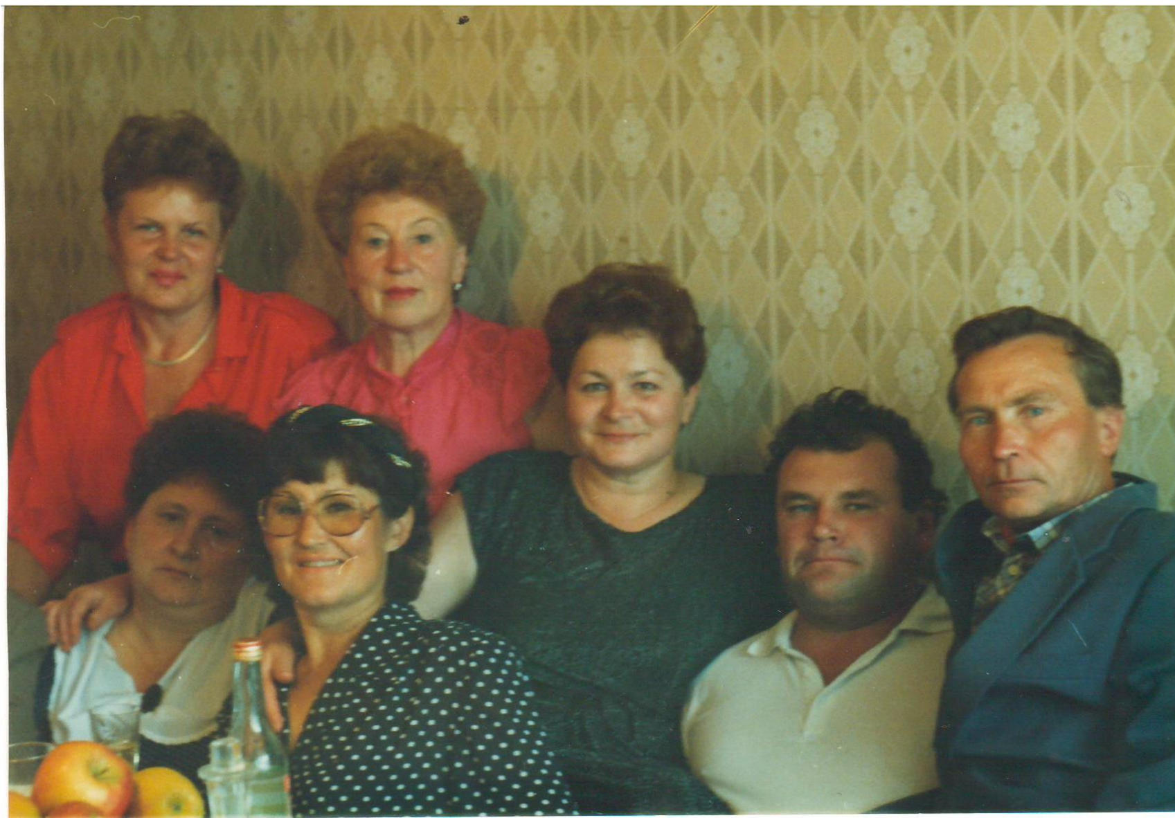
Коллектив станции 2003 год