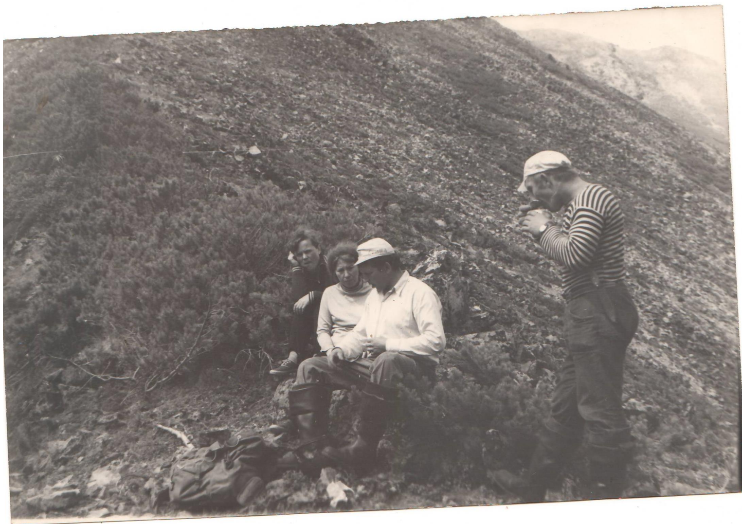
(Полевой выход сотрудников станции)