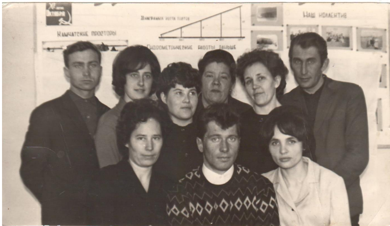
Коллектив станции в 1965-1998гг.