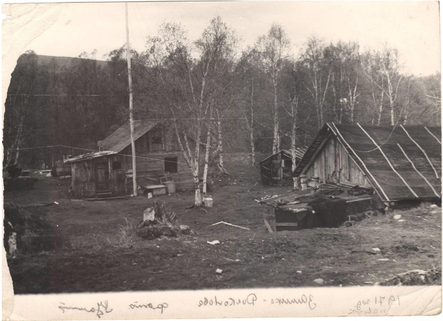
Пост заимка Дьяконова река Правая Авача