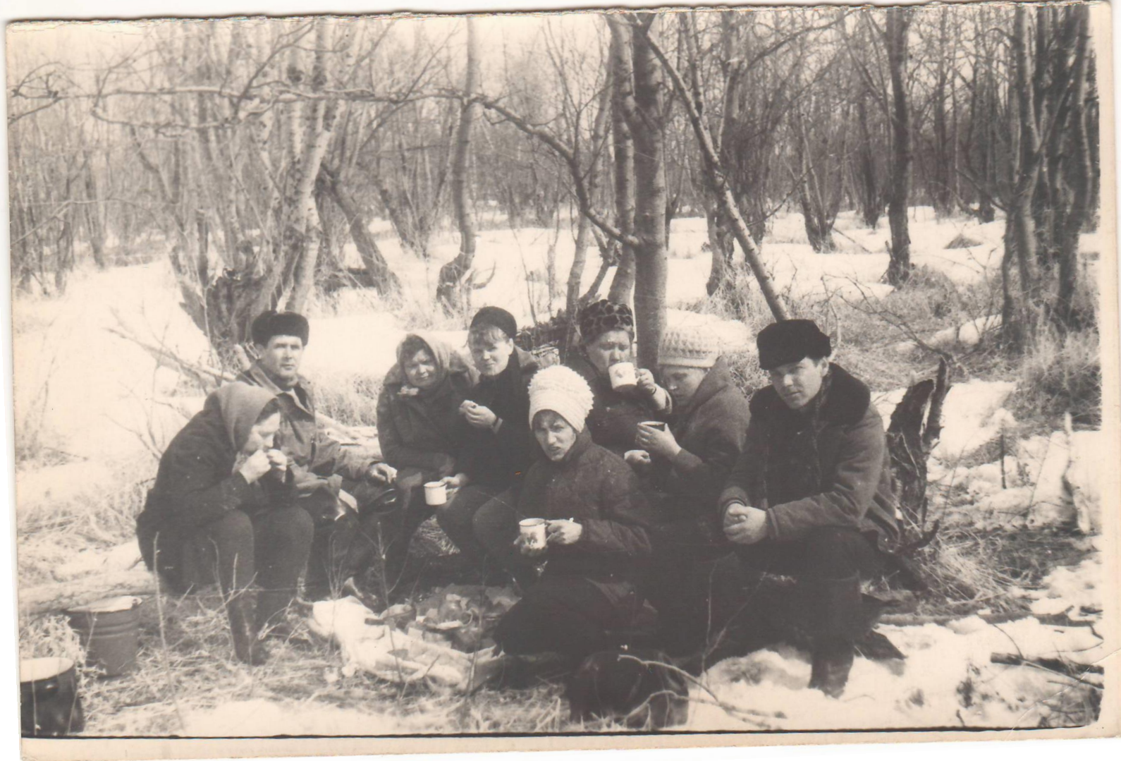
ВСЕСОЮЗНЫЙ ВОСКРЕСНИК 17 АПРЕЛЯ 1971 ГОД Коллектив станции на реке Мутная Камчатка