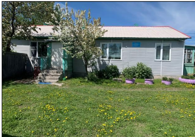
(Здание метеостанции М-2 Козыревск)

Пусть каждый день нашей деятельности будет наполнен новыми идеями, успехами и свершениями.