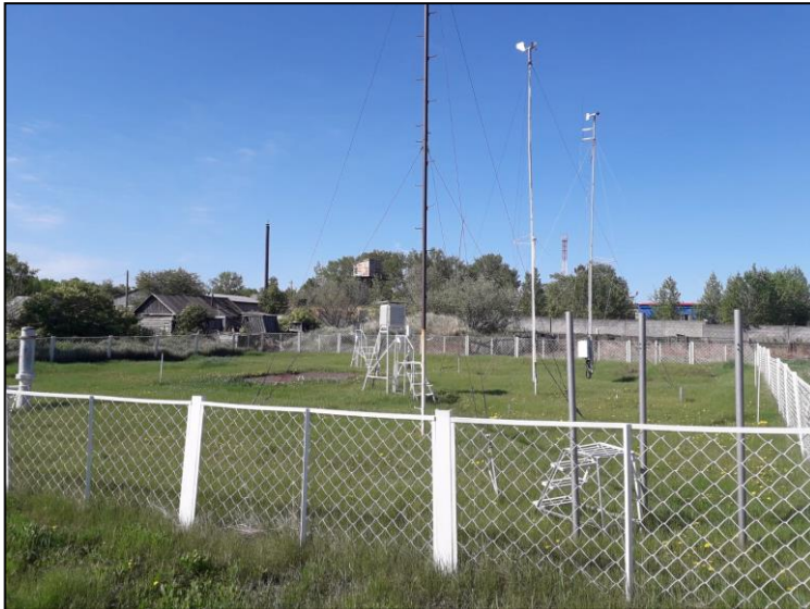
(Метеорологическая площадка М-2 Козыревск)

На сегодняшний день труд метеорологов облегчен, так как на станции М-2 Козыревск, установлен автоматизированный метеорологический комплекс (АМК). Благодаря автоматическому сбору необходимых данных, осуществляется своевременная отправка метеорологических сводок и обеспечивается постоянная работа станции.