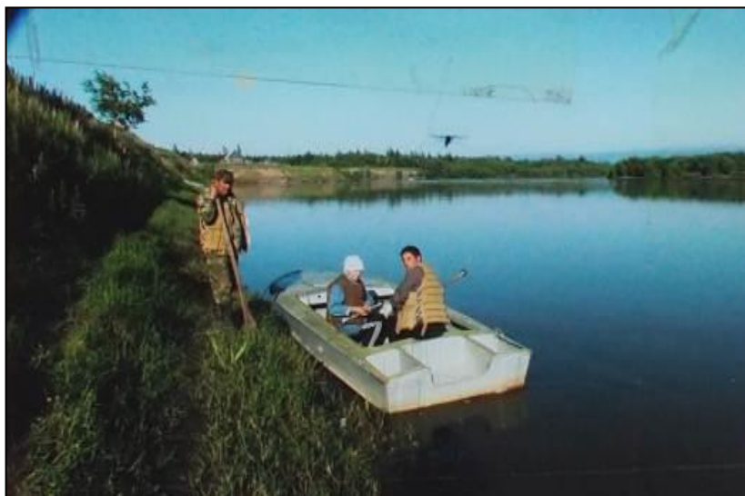
Измерение расхода в створе гидрологического поста

категории, который успешно работает с 2010 года. Терещенко М.В. - агрометеоролог 1 категории, работает на должном уровне с 2008 года, имеет профильное образование.